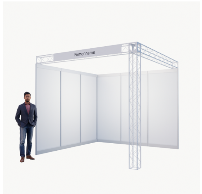
Eckstand* 2 Seiten offen