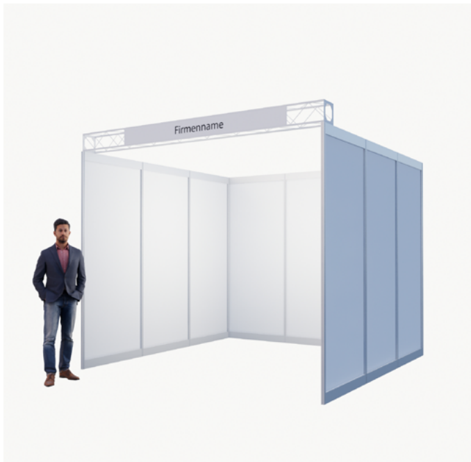
Reihenstand* 1 Seite offen